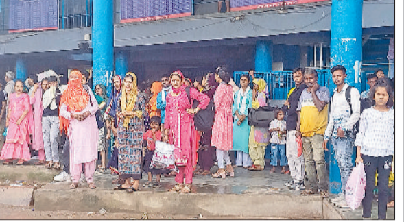
रेवाड़ी। बस स्टैंड से सवारियां भरकर जाते हैं प्राइवेट बस, बस स्टैंड पर अपने रूट की बस के इंतजार में यात्री, बस स्टैंड पर रोडवेज बस का इंतजार करती महिलाएं।

मिष्ठान मंडारों व राखी की स्टॉलों पर रही भीड़। रक्षाबंधन पर बाजार में राखी की स्टॉलों पर महिलाओं व युवतियों की काफी भीड़ रही। बहनें अपने भाईयों की कलाई पर बांधने के सुंदर राखी पसंद करती नजर आईं। शहर के पंजाबी मार्केट, मोती चौक, गोकल बाजार, पेठा बाजार व बीएफजी मॉल में महिलाओं की काफी भीड़ रही। इसके अलावा शहर के मिष्ठान मंडारों पर भी लोग मिठाई खरीदते नजर आए।