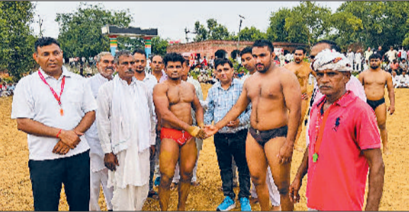
रेवाड़ी। कुश्ती दंगल में पहलवानों का परिचय करते अतिथि व ग्रामीण।