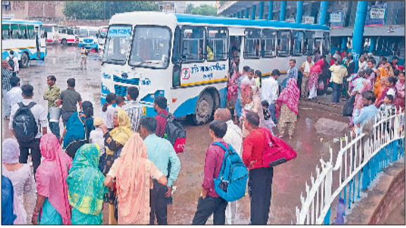
रेवाड़ी। बस स्टैंड से सवारियां भरकर जाते हैं प्राइवेट बस, बस स्टैंड पर अपने रूट की बस के इंतजार में यात्री, बस स्टैंड पर रोडवेज बस का इंतजार करती महिलाएं।

शनिवार को रोडवेज डिपो की ओर से चंडीगढ़, जयपुर व जालंधर जैसे लंबे रूट की बसों को दिन में भीड़भाड़ वाले लोकल रूट पर चलाया गया ताकि महिलाओं को परेशानी हो और शाम को लंबे रूटों के लिए इन बसों रवाना किया गया। बस स्टैंड पर नारनौल, महेन्द्रगढ़, कोटकासिम, दिल्ली, पटौदी, सोहना, कोसली व अलवर के बूथ पर ज्यादा भीड़ रही। रोडवेज डिपो की करीब 160 बसें मध्यरात्रि तक अपने रूटों पर दौड़ती रही। लोकल रूटों के बसों ने अधिक फेरे लगाए। रोडवेज स्टाफ महिलाओं को बसों