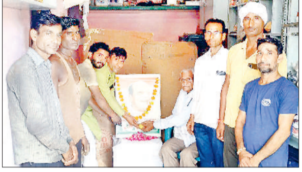
नारनौल। जन्मदिवस पर पूर्व मंत्री कर्नल राव रामसिंह को नमन करते हुए।