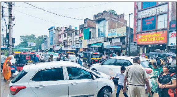
रेवाड़ी। बस स्टैंड के बाहर बनी जाम की स्थिति। में प्री सुविधा देने के इंतजार में देर लगा रहा। इसके अलावा बस