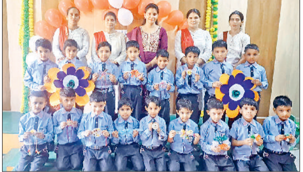
कनीना। एसडी स्कूल में आयोजित समारोह में हिस्सा लेते विद्यार्थी।