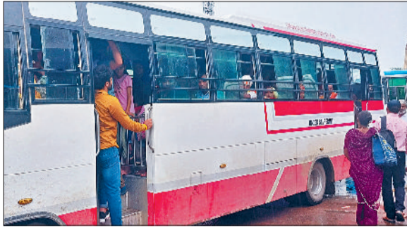
रेवाड़ी। बस स्टैंड से सवारियां भरकर जाते हैं प्राइवेट बस, बस स्टैंड पर अपने रूट की बस के इंतजार में यात्री, बस स्टैंड पर रोडवेज बस का इंतजार करती महिलाएं।

जिले में रक्षाबंधन का त्योहार हर्षोल्लास के साथ मनाया गया। शनिवार सुबह से ही लगातार चल रही रिमझिम बरसात के बीच बस स्टैंड पर शाम तक महिलाओं का आवागमन चलता रहा। रक्षाबंधन पर जहां दिन में ट्रैफिक व्यवस्था ठीक रही, वहीं शाम से देर रात्रि तक सरकुलर रोड सहित अन्य मार्गों पर कूटी। हालांकि शुकुवार की अपेक्षा शनिवार को बस स्टैंड पर ज्यादा भीड़ नहीं रही। रक्षाबंधन के त्योहार पर कई प्राइवेट बस संचालकों ने सवारियों से दोगुना तक किराया भी वसूला।