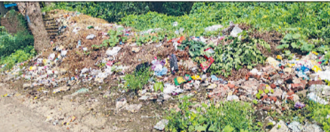
पशु अस्पताल के रास्ते में डाला गया कचरा

लोगों में सांस की बिमारी, डेंगू व कैसर जैसी धातक बीमारी होने का डर बना हुआ है। गंदे पानी के कारण आसपास के पेड़-पौधों को भी नुकसान पहुंच रहा है। गंदे पानी के कारण जोहड़ में