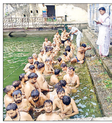
नारनौल। शिव कुंड ढोसी में स्नान करते विप्रजन व ढोसी में आयोजित कार्यक्रम में भाग लेते विप्रजन।