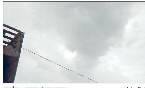
नारनौल। आसमान में छाए बादल।

स्थानों पर हल्की बारिश व बूदाबांदी हुई। जिससे सम्पूर्ण इलाके में दिन व रात के तापमान में हल्की गिरावट देखने को मिली। हरियाणा एनसीआर दिल्ली में अधिकतर स्थानों दिन व रात के तापमान सामान्य से नीचे बने हुए हैं। जिले में सुबह से शाम तक लगातार बादलों की आवाजाही के बीच हल्की बारिश व बूदाबांदी हुई। जिससे मौसम सुहावना बना रहा। जिले में नारनौल व महेंद्रगढ़ का दिन तथा रात का तापमान क्रमशः 34.5, 25.5 डिग्री सेल्सियस व 34.0, 27.2 डिग्री सेल्सियस दर्ज किया गया।