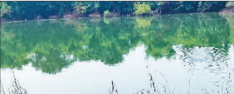
मीरपुर के जोहड़ में जमा गंदा पानी

आदर्श गांव मीरपुर वायु प्रदूषण की चपेट में आता जा रहा है। गांव की नालियों से निकलने वाले गंदे पानी को कई वर्षों से प्राचीन जोहड़ में डाला जा रहा है। गांव का प्राचीन जोहड़ रिहायसी क्षेत्र में है तथा जोहड़ के नजदीक सीएचसी व पशुओं का अस्पताल स्थित है। जोहड़ के दूषित पानी के कारण ग्रामीणों व सीएचसी स्टाफ को परेशानी का सामना करना पड़ रहा है। ग्रामीणों ने बताया कि जोहड़ में जमा दूषित पानी की वजह से